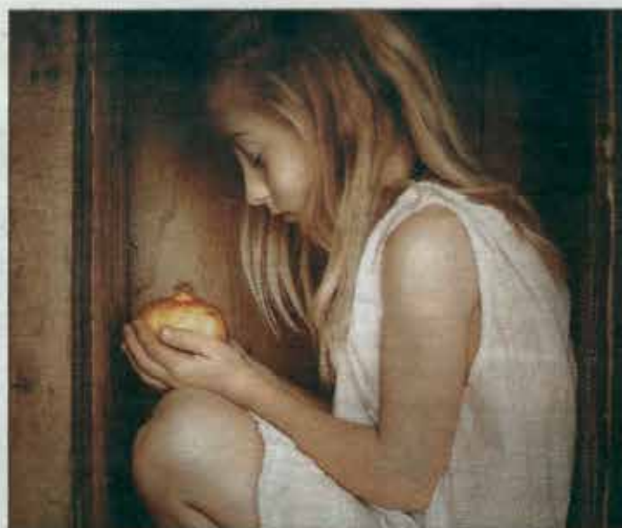
Les photos de Bénédicte Hanot, sont loin des clichés

Bénédicte participait dernièrement aux rencontres artistiques de Vernègues et rem-