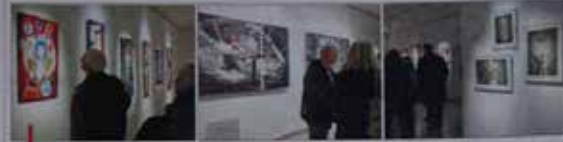
La nouvelle exposition de Provence-Languedoc présente une grande diversité d'œuvres et de formes d'expression.